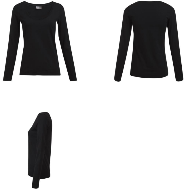
Damen Slim Fit Langarm T-Shirt.