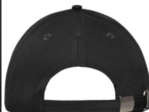
6-Panel Workwear Cap - Solid.