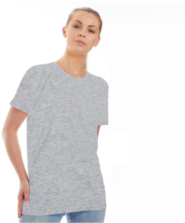
Unisex Basic T-Shirt.