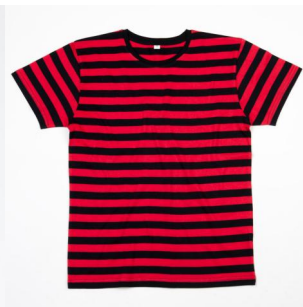
Gestreiftes Herren T-Shirt.