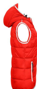
Damen Steppweste mit Kapuze.